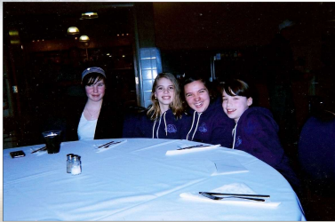
Territoires du Nord-Ouest