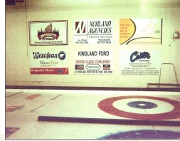
Territoires du Nord-Ouest